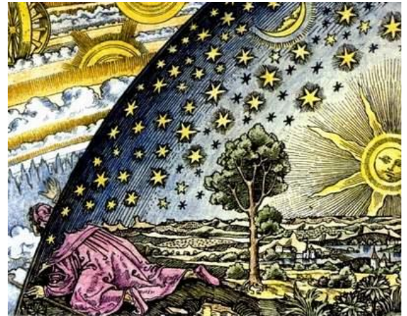
NEUGIER - Camille Flammarion, „L'atmosphère Météorologie populaire“, Paris 1888

Das sind die „Killer“, die Neugier und Motivation im Keim ersticken lassen.